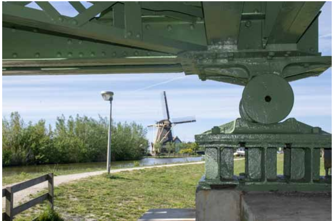
Molen 'De Korpershoek' vanonder de Trambrug.

Tegen de achtergrond van die geschiedenis kunnen de volgende kernwaarden worden benoemd: